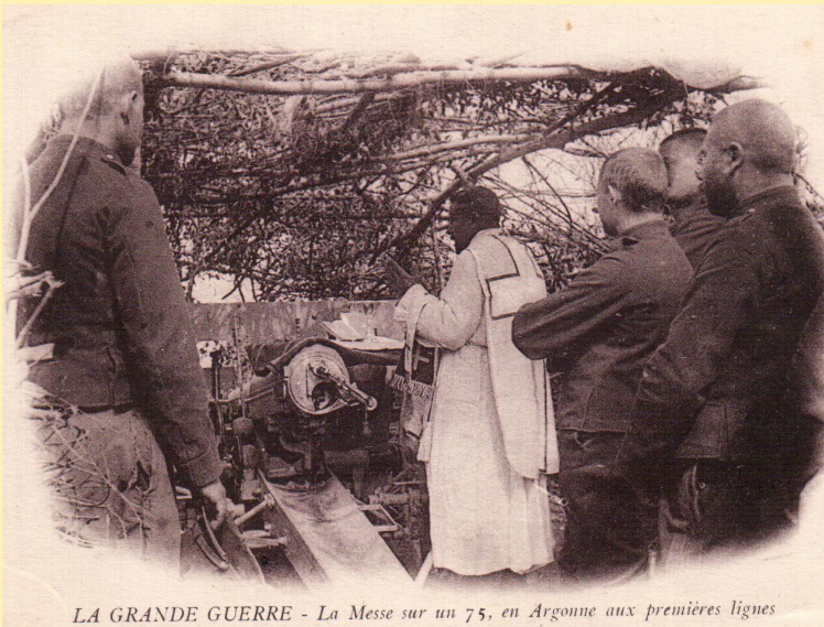
LA GRANDE GUERRE - La Messe sur un 75, en Argonne aux premières lignes